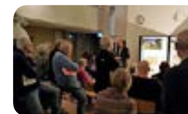
Presentatie Hooijschuur architecten