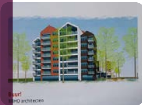
Buurt BBHD architecten

Gevolg van onderstaande bijeenkomst: 1 mei 2017 – Bericht over nieuwbouw Amandelbloesem