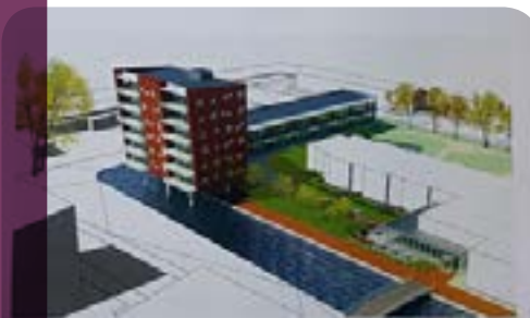
Hof van Wormerveer Hooijschuur architecten + adviseurs