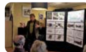
Presentatie BBHD architecten

De aanwezigen waren zeer geïnteresseerd en reageerden positief kritisch op de plannen. Men wilde informatie over de grootte van de woningen, het parkeren, de situering van het nieuwe gebouw t.o.v. de bestaande bebouwing. Maar ook hoe de verbinding en bereikbaarheid was tussen nieuwbouw en restaurant. Eveneens was men geïnteresseerd in de tuin en het water op het terrein.