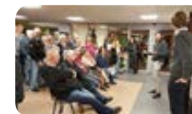
Presentatie Nunc architecten

Na afloop kon men per plan een kaartje invullen met vragen over: